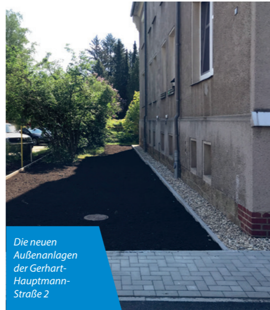
Die neuen Außenanlagen der Gerhart-Hauptmann-Straße 2

Wie bereits im Grußwort angesprochen möchten wir Sie über den Stand der größeren Baumaßnahmen informieren.