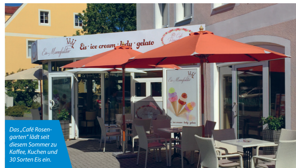
Das „Café Rosengarten“ lädt seit diesem Sommer zu Kaffee, Kuchen und 30 Sorten Eis ein.