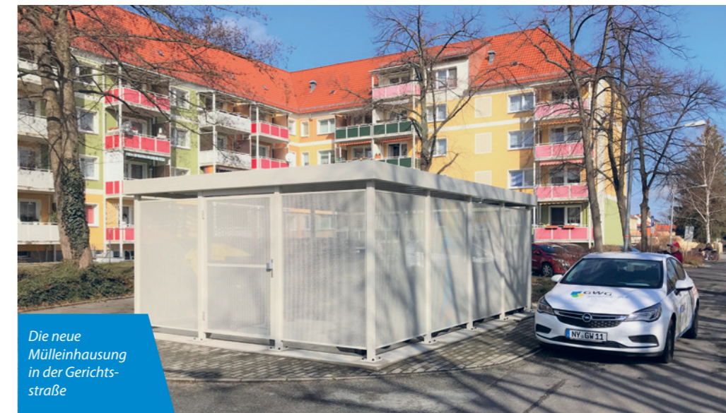
Die neue Mülleinhausung in der Gerichtsstraße