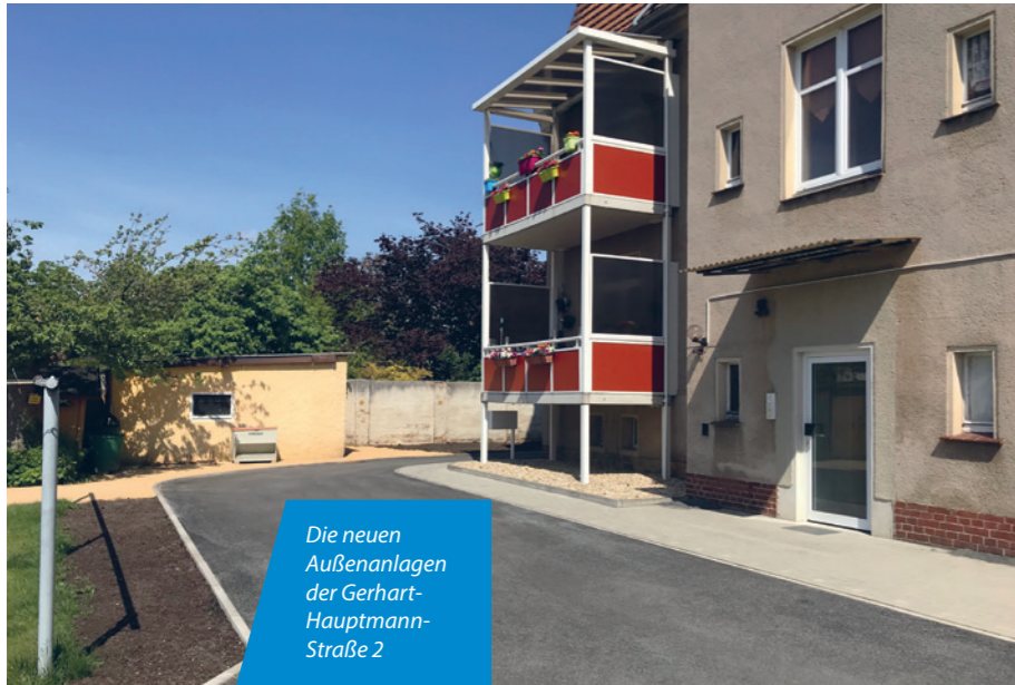
Die neuen Außenanlagen der Gerhart-Hauptmann-Straße 2