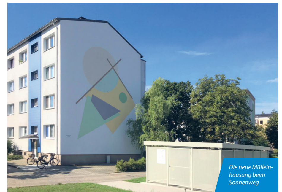
Die neue Mülleinhausung beim Sonnenweg