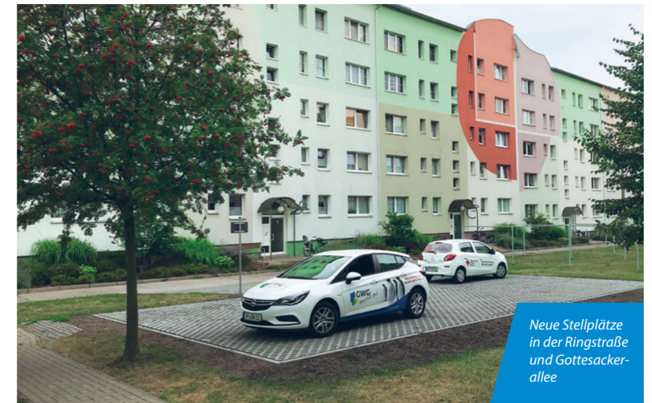
Neue Stellplätze in der Ringstraße und Gottesackerallee

Den für dieses Jahr angedachten Bau einer neuen Fahrradgarage werden wir nun im Geschäftsjahr 2021 realisieren, da wir unsere Planung erweitert haben und zusätzlich eine qualitativ hochwertige Abfallbehältereinhausung schaffen werden um zusätzlichen Platz bei der Abfallentsorgung zu gewinnen. ■