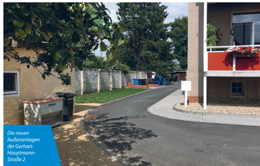
Die neuen Außenanlagen der Gerhart-Hauptmann-Straße 2

Bei beiden Standorten wurde ab März 2020 mit der Errichtung von befestigten, überdachten und teilgeschlossenen Abfallbehältereinhausungen das Wohnumfeld wesentlich aufgewertet und attraktiver gestaltet. Insbesondere für die Herbst- und Wintermonate sollte sich damit die Abfallentsorgung für unsere Mieter wesentlich angenehmer darstellen.